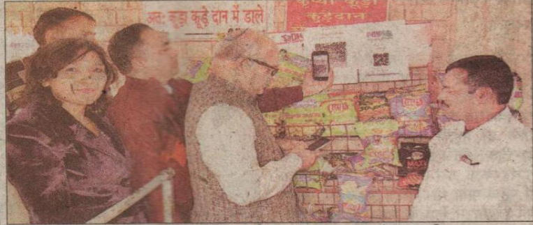
हिसार। चाय की स्टाल से पीटीएम से भुगतान करते कुलपति।