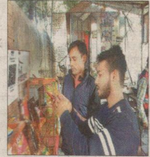
जीजेयू में चाय की यड़ी पर पेटीएम करता छात्र।

विद्यार्थियों ने की तारीफ : स्टॉल पर चाय पी रहे विद्यार्थियों ने बताया कि नोटबंदी के बाद कुछ दिन में ही इन्हें कम ही आते थे। लेकिन विश्वविद्यालय में कई जगहों पर पेटीएम व अन्य सेवाएं देरी से शुरू हुईं, जबकि उनके पास सबसे पहले शुरू हो गई थी। इसलिए पेटीएम की सुविधा शुरू होते ही टीचर उनके पास चाय पीने के लिए बड़ी संख्या में आने लगे हैं।