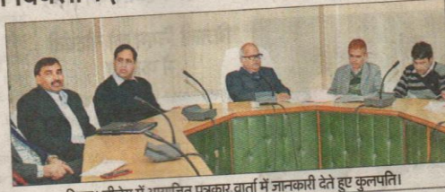
हिसार। जीजेयू में आयोजित पत्रकार वार्ता में जानकारी देते हुए कुलपति।