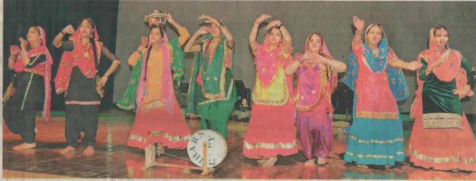
जीजेयू के पूर्व छात्र सम्मेलन में सांस्कृतिक प्रस्तुतियों के दौरान कृष्ण प्रस्तुत करती हुई प्रतिभागी।