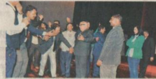
पूर्व विद्यार्थी से एम्बेसडर बनने के लिए वीसी के लिए एक हजार रुपये दिए गए हैं। इन्होंने पूर्व विद्यार्थी कमी भी लक्ष्मी

कई सालों के बाद जब एक साथ बैठे हुए विद्यार्थी एक दूसरे के साथ मिलने लगे थे तो खेद सहित ही। वही कठपुतली व कि रणजय में बैठने की बजाय पूर्व विद्यार्थी विवि में इतर उतर एम्बेस में जवाब देते रहे थे। सालों बाद श्रिनि में हुए परिचय के बारे में हर कोई बात कर रहा था। पूर्व विद्यार्थी वृत्त-वृत्त कार्यक्रम होने के बाद भी जीट में पहुंचे और श्रम के छात्र सांस्कृतिक कार्यक्रम के दौरान जब वीसी रणजय में पहुंचे तो पूर्व विद्यार्थियों ने उन्हें भी थिरकने के लिए मजबूर कर दिया। बातें कि प्रारंभिक