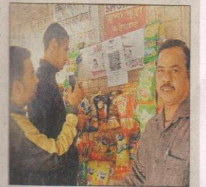
टी-स्टॉल पर पीटीएम से भुगतान करते छात्र।

उन्होंने छात्रों की सहूलियत को देखते हुए पेटीएम की व्यवस्था स्टॉल पर की गई है। गुजवि में पीएनबी बैंक की शाखा है। इसमें विवि के अकाउंट के बराबर विवि के बहन के