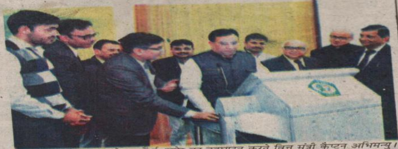
हिसार. पूर्व छात्र सम्मेलन में ई-स्टोर का उद्घाटन करते वित्त मंत्री कैप्टन अभिमन्यु।

कैप्टन अभिमन्यु ने कहा कि कलयुग में सबसे बड़ी शक्ति संगठन की है। हम संगठित होकर ही देश व समाज को आगे ले जा सकते हैं। राज्य सरकार का इस वर्ष का बजट 89 हजार करोड़ रुपये है। हमारी जिम्मेदारी बनती है कि प्रदेश की जनता के इस पैसे का सदुपयोग करें तथा प्रदेश के विकास के लिए अपना योगदान दें। उन्होंने पूर्व छात्रों से कहा कि वे अपने संस्थान से दोबारा से जुड़ें तथा संस्थान व संस्थान के विद्यार्थियों के विकास में अपना योगदान दें। कैप्टन अभिमन्यु विश्वविद्यालय के विश्वविद्यालय स्तरीय पूर्व छात्र संघ के प्रथम सदस्य के रूप में भी पंजीकृत हुए हैं। उन्होंने पूर्व छात्र संघ के लिए एक लाख रुपये का अनुदान भी